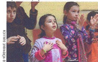
Répétition d' Iphigénie à Montreuil.

conforme à celle établie par le mythe... dans les grandes lignes. Les enfants ont choisi de faire de l'héroïne le symbole de l'obéissance. Obéir ou désobéir au roi Agamemnon? Telle est la question. Natascha a opté pour le slam comme mode de déclamation du chœur où le corps a également sa place. Découverte de la mythologie grecque, d'Iphigénie et de sa généalogie, des théâtres antique et classique, ce programme Arthécimus rend toutes les facettes de l'invention artistique accessible. Décidément, tel le Rodrigue de Corneille, artistes, enfants et animateurs ont vraiment du chœur! ● Anne Locqueneaux